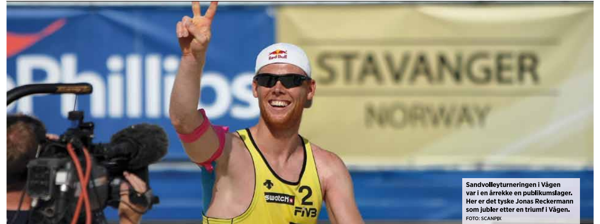
Sandvolleyturneringen i Vågen var i en årrekke en publikumslager. Her er det tyske Jonas Reckermann som jubler etter en triumf i Vågen.